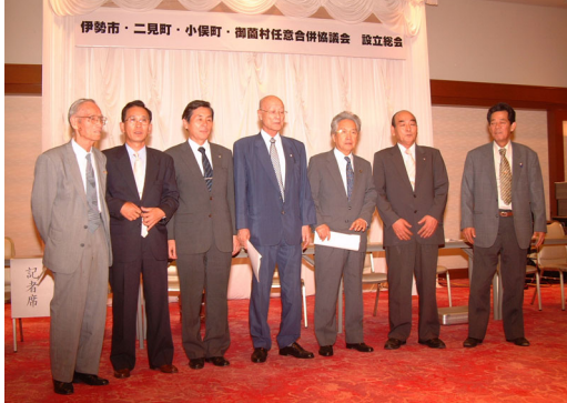
①伊勢市・二見町・小俣町・御園村 任意合併協議会設立