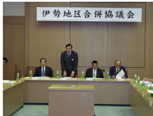
⑭伊勢地区合併協議会 (1)