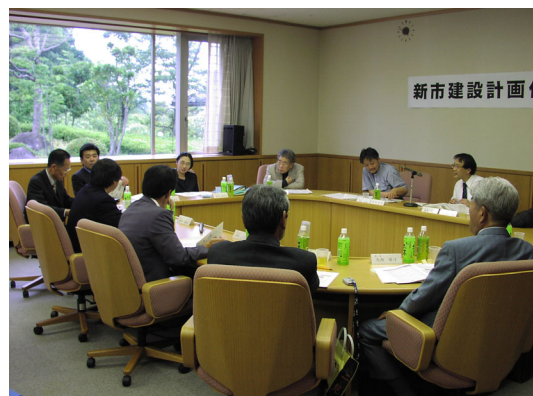
⑯新市建設計画作成小委員会