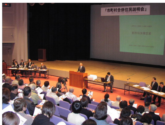
⑪市町村合併住民説明会（１）