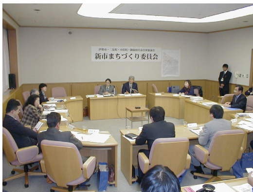
⑤新市まちづくり委員会