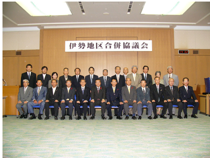
㉑ 第20回（最終）合併協議会（2）