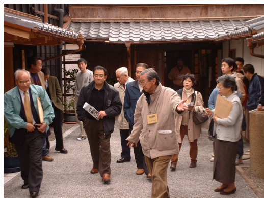
⑥まちづくり隊タウンウォッチング