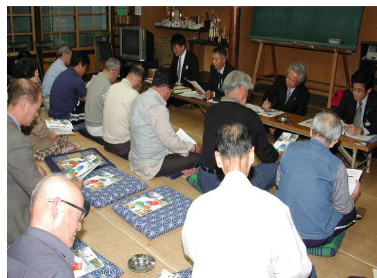
⑫市町村合併住民説明会（２）