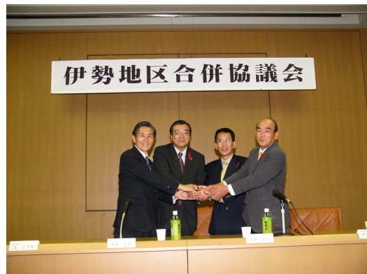
⑳ 第20回（最終）合併協議会（1）