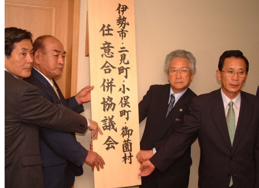
②任意合併協議会事務局設置