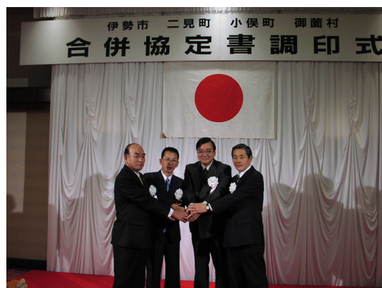
⑰合併協定書調印式 (1)