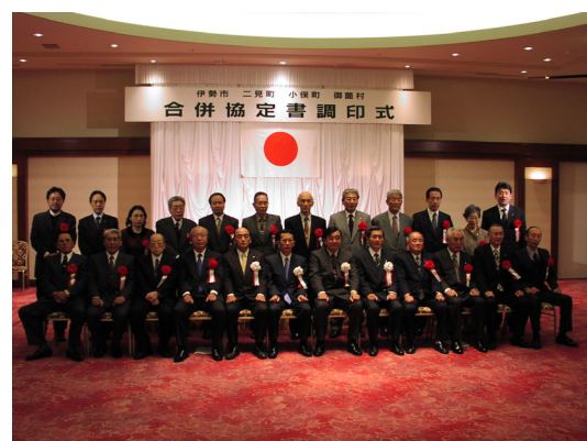
⑱合併協定書調印式 (2)