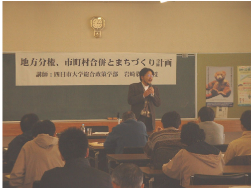
⑦まちづくり講演会