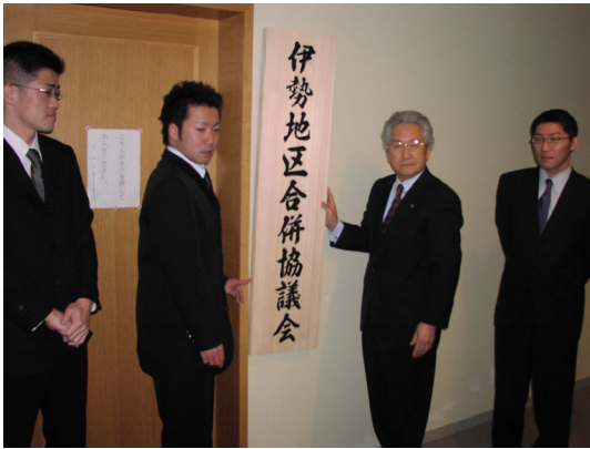
⑬伊勢地区合併協議会事務局設置