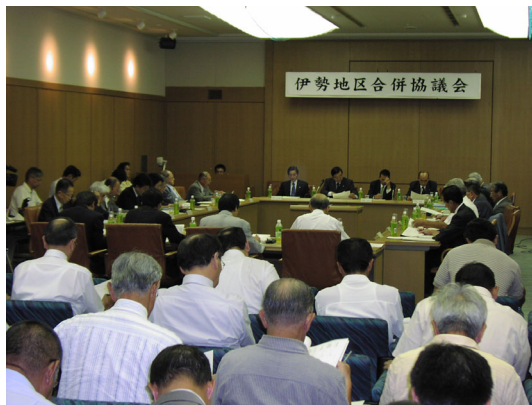
⑮伊勢地区合併協議会 (2)